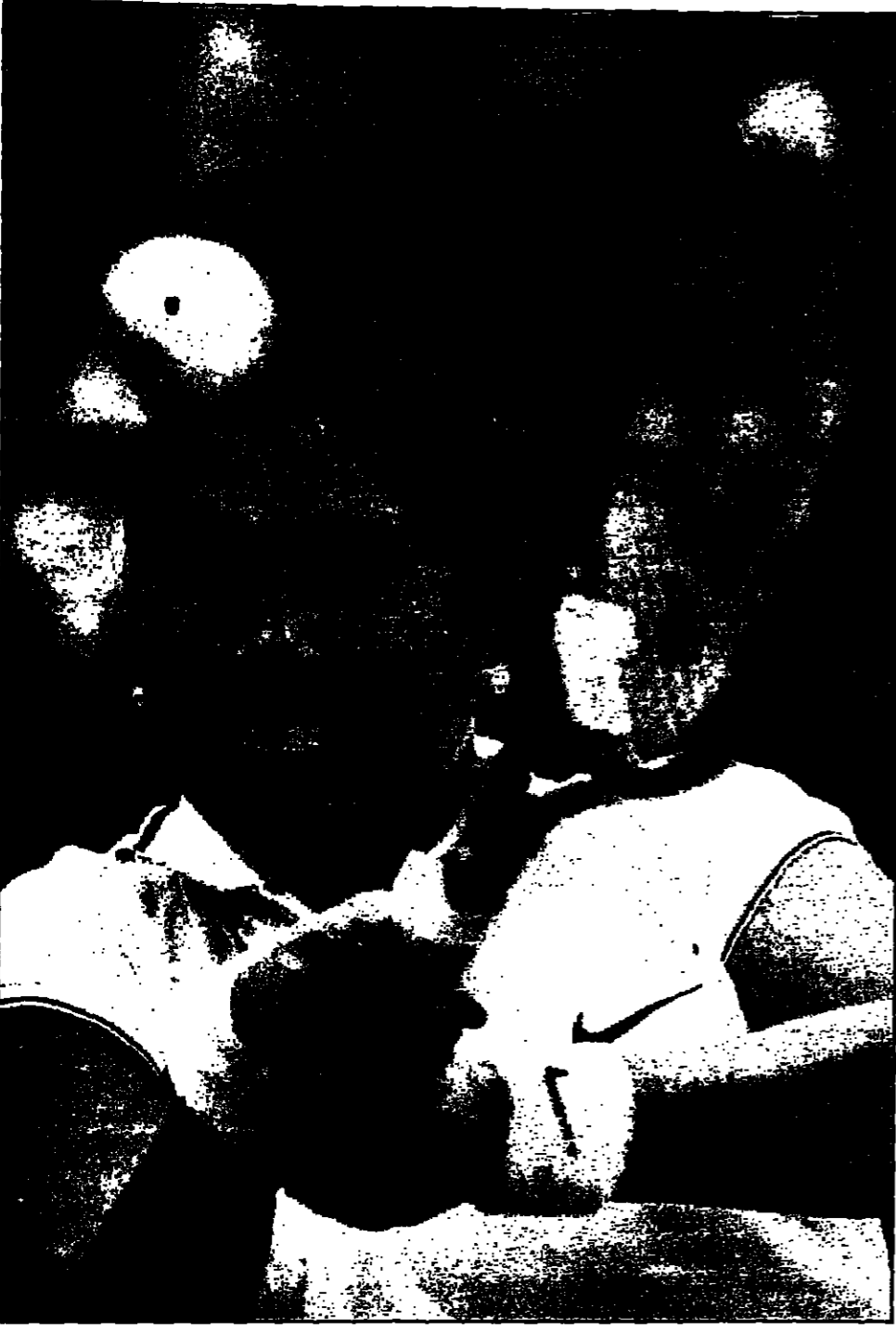
أندريه أغاسي يلعب في بطولة نيو هافن.